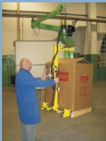
Movimentazione di pallet con grandi scatole di cartone per mezzo di un INDEVA modello Liftronic montato a colonna