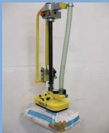
Un Indeva per movimentare sacchi modello Liftronic montato su colonna (L80C) sistema di presa con il vuoto. Dotato di maniglia sensitiva lunga.