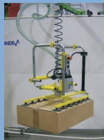
INDEVA modello Liftronic vacu-u-grip, sistema di presa con vuoto, maniglia sensitiva lunga; maniglie di presa posizionate in modo da permettere il posizionamento della scatola all'interno di un'altra scatola più grande.